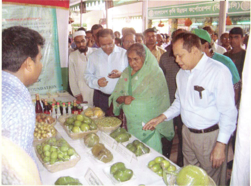
মাননীয় কৃষিমন্ত্রী ও মাননীয় পরিবেশ ও বনমন্ত্রী বিএআরসিতে অনুষ্ঠিত জাতীয় ফল প্রদর্শনী ২০১৩ হর্টেক্স ফাউন্ডেশনের স্টল পরিদর্শন