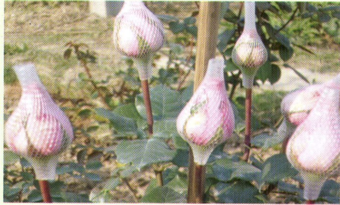
রোজ ক্যাপসহ গোলাপ উৎপাদন

● কৃষকদের উন্নত সাপ্লাই চেইন ও বাজার ব্যবস্থাপনা সংক্রান্ত বিভিন্ন বিষয়ের উপর জ্ঞান ও দক্ষতা উন্নয়নের লক্ষ্যে এ যাবৎ মোট ১৩৭৭৭ জন প্রকল্পের সুবিধাভোগীকে প্রশিক্ষণ প্রদান করা হয়েছে।