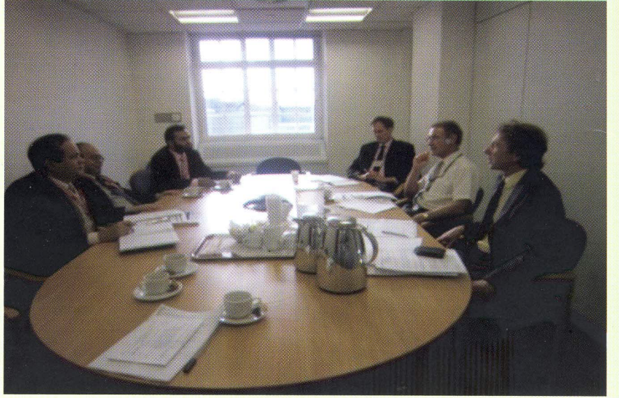
যুক্তরাজ্যের ডেফরা প্রতিনিধি দলের সাথে লেবু রগুনির জন্য বাংলাদেশ প্রতিনিধি দলের সভা

● শীততাপ নিয়ন্ত্রিত (Cool Chain) ব্যবস্থায় কৃষিপণ্য পরিবহনে বিভিন্ন ব্যবসায়িক প্রতিষ্ঠানকে ১৪২৩টি ট্রিপের মাধ্যমে পঁচনশীল ও উচ্চ তাপমাত্রায় সংবেদনশীল পণ্যের গুণগতমান রক্ষাকরণে সহযোগিতা প্রদান করা হয়েছে