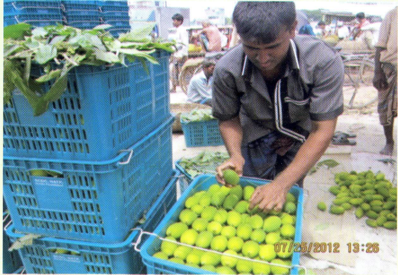
উন্নত মানের প্লাস্টিক ক্রেটের মাধ্যমে বাছাইকৃত কাকরোল বিপণনের

● কৃষি পণ্যের সার্টিং, গ্রেডিং, উন্নত প্যাকেজিং, পরিবহন ও সংগ্রহোত্তর অপচয় রোধের মাধ্যমে সরাসরি সিসিএমসির মাধ্যমে কৃষি পণ্যের বাজারজাত করায় পণ্য ভেদে কৃষকদের ১০-৪০% আয় বৃদ্ধি করা সম্ভব হয়েছে। প্রকল্পভুক্ত প্রতি কৃষক পরিবারের বার্ষিক আয় গড়ে প্রায় ১১০০০ টাকা বৃদ্ধি পেয়েছে।